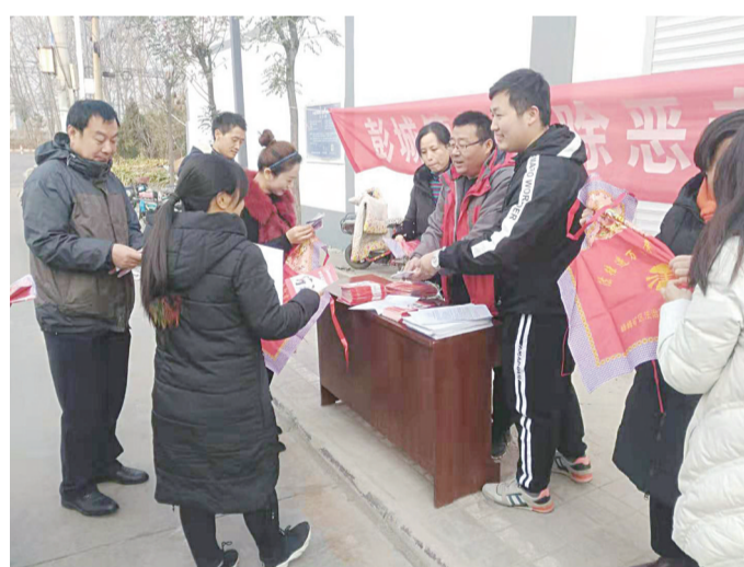
邯郸市峰峰矿区彭城镇积极开展扫黑除恶宣传工作,提升群众参与意识,深挖黑恶问题线索。今年以来,该镇已发放宣传手册2000余册,张贴公告1000张,发放明白纸5000份,悬挂条幅和标语300余条,组织社区村庄小型宣传20余场次,收效良好。图为工作人员向群众发放宣传材料。