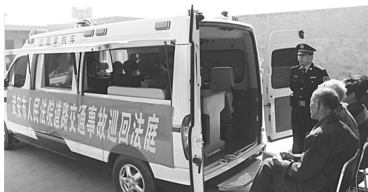
武安县人民法院道路交通事故巡回法庭开庭。

办公,事故当事人足不出院、足不出楼即可解决道交纠纷。同时,树立调解优先理念,组织民调、保险、律师等部门,结合网上数据一体化处理平台测算系统,线上、线下优先进行诉前调解,调解成功的,法庭出具确认书或调解书,有效地提高了诉前调解的成功率。对达不成调解协议的案件,推行十要素审理法,让当事人填写《案件要素信息调查表》,庭前准备普及化,确认无争议的要素,开庭着重审理有争议的要素,制作要素裁判文书,最大限度地提高审理效率减少周期,把交通事故案件审结周期缩短到22天。