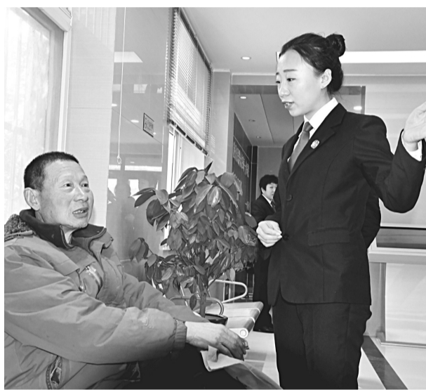
在大名县人民法院诉讼服务中心,工作人员为前来诉讼的群众讲解立案知识和流程,引导其通过诉前调解解决纠纷。

其次,该院还依据常见案件类型,在诉讼服务中心设立了家事、道交、医疗、律师、代表委员等10个专业调解室,接受诉讼服务中心委托有针对性地开展诉外化解工作,实现了“一站式”调处服务。此外,对于分流调解不成功的案件,该院在诉讼服务中心设立速裁团队,充分发挥自身调解优势和速裁的力度,提升审判质效。据统计,截至目前,该院委托人民调解组织化解纠纷965件,当事人满意度达95%以上;调解撤率、服判息诉率、诉前分流率、诉前化解率等审判质效指标始终位于省市法院系统前列,司法公信力不断提升。