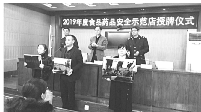
新乐市委、市政府高度重视食品药品安全工作,将打造食品药品安全示范店列入新乐市政府为民办实事利民惠民20项民心工程。新乐市市场监督管理局全力打造30家食品药品安全示范店,并加强对示范店的日常监管,巩固和提升示范创建效果,推进全市食品药品安全水平再提升。图为该局举办食品药品安全示范店授牌仪式。

据,便衣民警继续对其秘密跟踪。16时30分许,民警在桥西区面粉厂街附近将张某抓获,现场缴获作案摩托车1辆、作案工具老虎钳1个、角磨机1个,并在其租用的车库内起获被盗窃山地自行车3辆。 经审讯,犯罪嫌疑人张某对多次盗窃高档山地自行车的事实供认不讳,初查涉案金额4万余元。目前,此案正在进一步处理中。