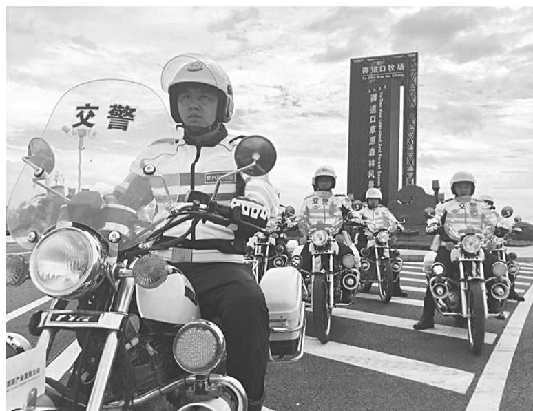
围场公安交警骑警队在坝上地区执勤。

该局整合警务资源,将各警种业务汇集到指挥中心合成作战室,积极协调民族、工商、安监等职能部门,建立联动处置机制。延伸服务群众触角,实现对非警务类求助事项的科分分流处理,确保群众求助及时妥善处置。截至目前,110指挥中心共接处警8万余起,受理群众求助2000余起。公安综合服务中心进一步深化“放管服”改革,打造程序最简、速度最快、效率最高、成本最低的一流办公环境。截至目前,办理户籍业务32825件,办理车驾管业务45892件,实现了服务“零差错”、群众“零投诉”。专门组建交警骑警队,作为街面常规巡逻警力的补充和叠加,充分发挥机动、灵活、快速的特点,切实提高警力的效率和应急处突的能力。组建专门服务企业的巡防队,并定期组织民警到企业内举办法律知识讲座。开通贫困群众法律援助绿色通道,加大涉农务工、医患、劳动报酬、社会保障等法律援助力度,开展法律援助150次,法律援助300次,接受群众咨询940次,群众安全感、满意度显著提升。