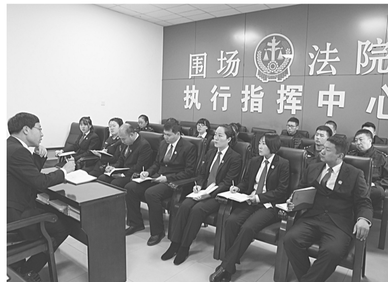
围场法院执行局每周五定期召开执行调度会,确保执行工作有序推进。

11月初,由执行局长带队连续开展集中执行、专项执行行动,进一步提高了执行威慑力。通过近10天的执行行动,共拘留15