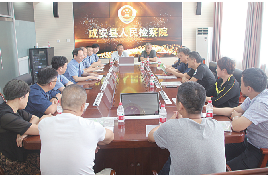
资讯图片:成安县检察院开展以“检察护航企业发展”为主题的检察开放日活动,座谈征求民营企业家、人大代表、政协委员、县工商联有关人士对检察工作的意见、建议。

以矛盾排查化解为重点,依法妥善处理涉稳信访。该院以整合后的“12309”检察为民服务大厅为平台,全力为人民群众提供优质、高效的检察服务。今年以来,该院共受理来信来访45件,移交检察一部、二部办理案件4件;办理各类控告申诉案件7件,申请国家赔偿1件3人;接受法律咨询23人次,检察长参加接待12次,处理群众来信4件,接待来访群众10人,圆满完成重要时间节点的维稳任务。