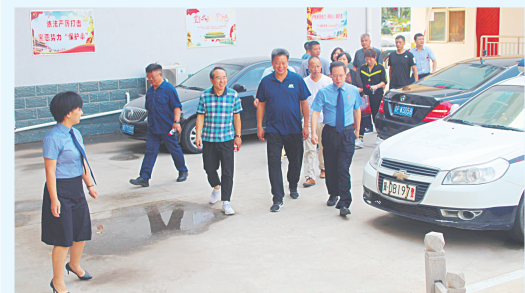
资讯图片:成安县检察院聚焦社会关切,提升司法公信力,组织开展检察开放日活动,邀请人大代表、政协委员、人民监督员及社会各界群众走进检察院,认真听取大家意见建议。

成安县检察院将进一步提升服务大局水平,推动“四大检察”全面协调充分发展,做优刑事检察、做强民事检察、做实行政检察、做好公益诉讼检察,聚焦全县工作大局,为当地社会稳定和经济发展提供强有力的检察保障。