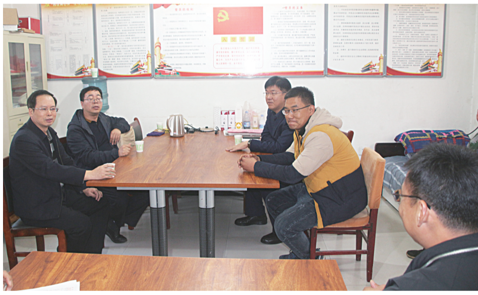
资讯图片:成安县检察院严格按照上级要求,积极走访调研指导基层党组织建设工作。

制定的5个配套制度组成的制度体系,实现公益诉讼从案件线索发现、诉前检察建议、提起公益诉讼、专家辅助人鉴定出庭、人民法院立案审理、行政机关配合执行、纪委检察双向移送线索等办案过程的全覆盖,把相关工作机制真正运用到实际办案过程中。