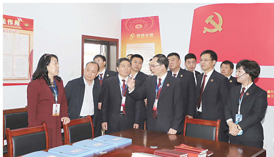
资讯图片:邯郸市检察机关“工学大竞赛”观摩团到成安县检察院观摩指导,为成安检察工作的创新发展提出了宝贵意见。

在公益诉讼检察工作方面,该院建立健全了公益诉讼工作机制,构建了公益诉讼“1+5”制度体系。以县“两办”出台的《关于支持县检察院提起公益诉讼工作的通知》为统领,加上与有关部门