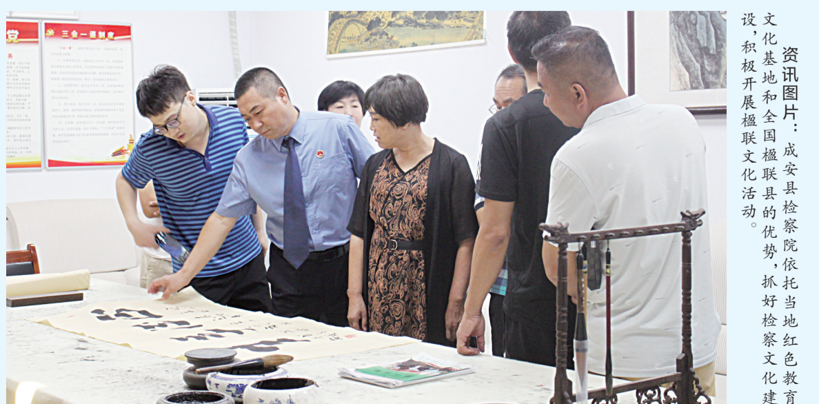
资讯图片:成安县检察院依托当地红色教育文化基地和全国楹联县的优势,抓好检察文化建设,积极开展楹联文化活动。