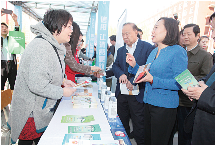
图为参会领导现场了解消费维权咨询服务情况。

据悉,2019年我省将继续加强消费教育和引导,强化消费领域信用体系建设,加大对商品和服务社会监督力度,并探索建立消费纠纷多元化解机制,完善诉讼、仲裁与调解对接机制。同时,强化职能部门合作,携手打击假冒伪劣商品和虚假广告宣传,努力净化消费环境,形成政府监管、社会监督、媒体监督、消费者监督的良好氛围。