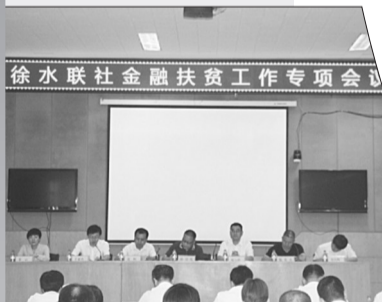
徐水联社开展金融扶贫系列活动,纵深推进“双基共建”,坚决打赢扶贫攻坚战。

小贷金融如火如荼,普惠金融全面铺开,各项业务快速发展……保定市徐水区农村信用合作联社不断适应新时代,抢抓新机遇,坚定支农支小方向,充分发挥自身优势,大力发展小贷金融、普惠金融,成为镶嵌在太行山脉上一颗耀眼的金融之星。截至2018年12月末,徐水联社各项存款1004723万元,较年初增加26560万元;各项贷款537137万元,较年初增加87112万元;不良贷款较年初压降10728万元;实现考核利润16532万元,拨备覆盖率151.13%,并于2018年12月20日正式进入改制辅导期。