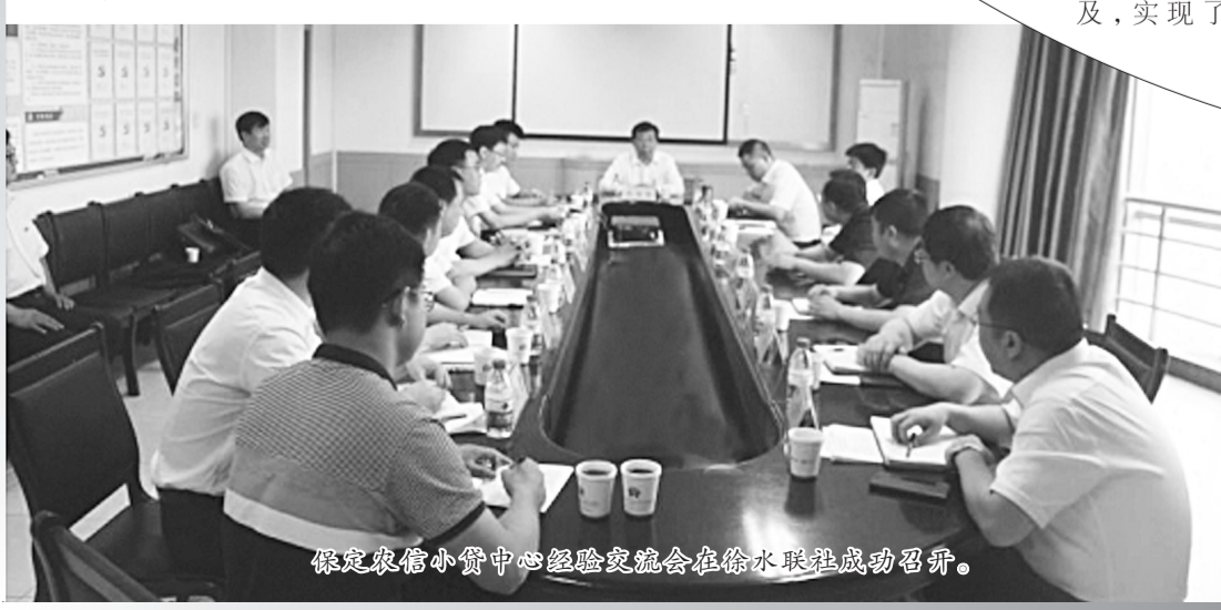
保定农信小贷中心经验交流会在徐水联社成功召开。