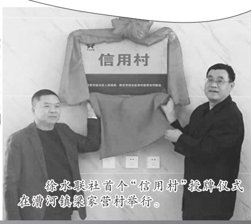
徐水联社首个“信用村”授牌仪式在荆河镇梁家营村举行。