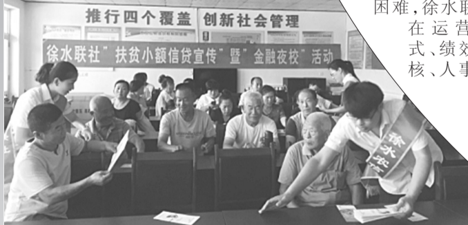
徐水联社“推行四个覆盖 创新社会管理”金融夜校活动。