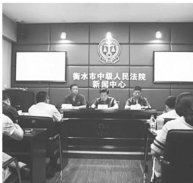
衡水中院召开以打促执新闻发布会。

本报讯 (记者 张兰华) 6月5日下午,衡水中院召开以打促执新闻发布会,向社会通报衡水两级法院在执行工作中采取纳入失信名单、限制高消费、罚款、拘留983人,罚款26人次,以拒执罪移送公安部门案件68人次,已经定罪处罚9人。