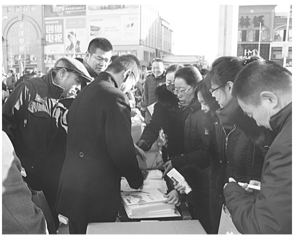
秦皇岛反邪教宣传展位前挤满了群众。