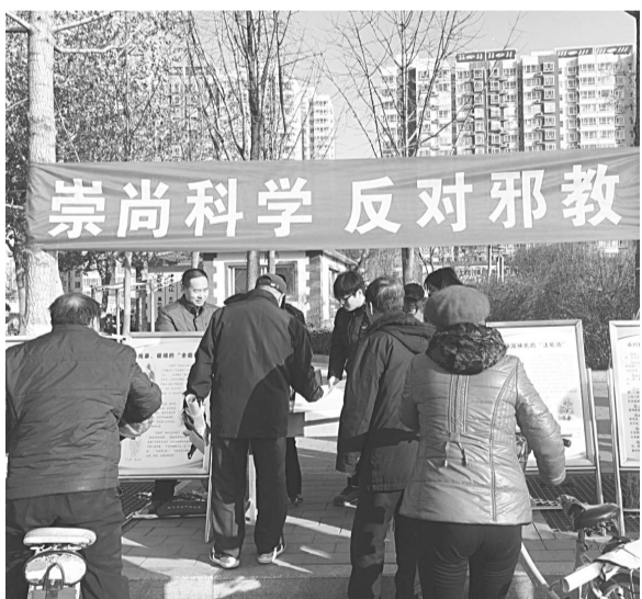
定州市反邪教宣传活动现场,工作人员正在向群众发放宣传资料。

活动现场摆放着《遇到邪教非法活动应该怎么办》《刑法300条》《误入邪教的五种诱因》等内容系列宣传展板,悬挂“崇尚科学、反对邪教”的条幅。本次活动共发放反邪教明白纸3000余份,关于对邪教违法犯罪活动实行有奖举报的明白纸100张,印有“崇尚科学、反对邪教”的纸抽200盒、手提袋300个。同时向过往群众宣讲了国家处置邪教的政策法规等。(花蕾)