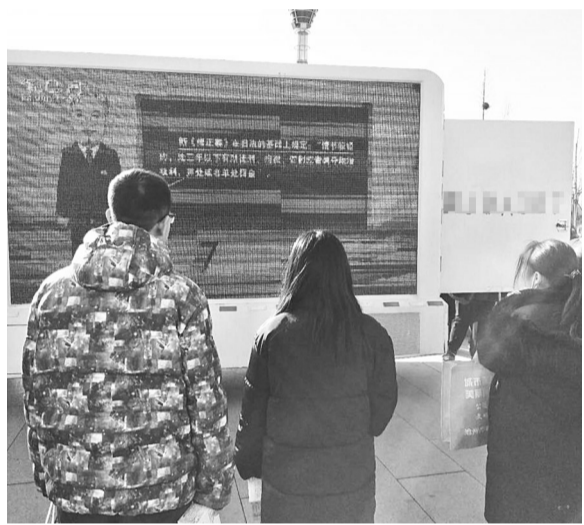
大篷车正在播出反邪教视频。

12月4日,沧州市30多个单位在狮城公园广场举行了“国家宪法日”集中宣传活动。市防范办、市反邪教协会及沧州运河区、新华区、沧县相关工作人员于当日一大早来到现场,开展系列反邪教宣传活动。一是出动大篷车,播放反邪教视频,滚动播出反邪教标语;二是在集中宣传活动现场展出12块反邪教警示教育展牌,介绍反邪教知识和发生在本地的邪教危害案例;三是发放反邪教明白纸、宣传彩页、小册子等宣传资料;四是由运河区制作反邪教宣传小纸抽、新华区制作反邪教宣传毛巾、沧县制作反邪教宣传笔记本各200个,与反邪教宣传资料搭配,在现场发放,不仅增强了宣传品的实用性,而且有效提升了宣传品的宣传效果,现场群众十分踊跃,效果良好。(沧防)