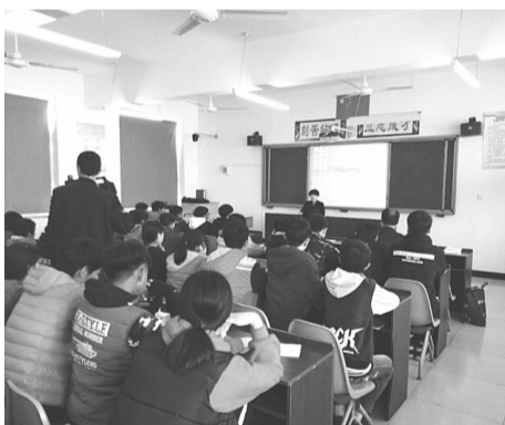
定州市防范办深入当地中小学校,结合反邪教工作,深入开展党的十九大精神宣讲活动。图为反邪教工作人员正在课堂给学生宣讲。(马春雷)