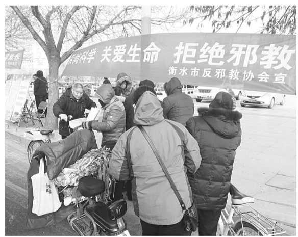
衡水市的反邪教宣传展位刚摆出不久,就吸引了众多过往群众。

全市各县(市、区)防范办、反邪教协会也分别在当地组织开展了集中宣传活动。(衡防)