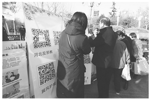
扫描反邪教微信、微博等网络媒体二维码。

一大早,法制公园内就已经人山人海,热闹非凡。晨练的人们在充分活动了筋骨之后,穿梭于各个法治宣传摊位前搜集法律法规知识材料,更有不少群众专门为法治宣传而来。在一进法制公园北门,右手边有一个比较显眼的位置,许多群众将这个宣传摊位围得严严实实。这里悬挂着反邪教宣传横幅,展示着30多块反邪教宣传展板和反邪教微信、微博等新媒体二维码。人们一看这里是反邪教法律宣传现场,不断向这边涌来。在现场,工作人员先后向群众发放反邪教宣传手册、明白纸等共计10000余份,还发放了大量印有反邪教内容的停车卡、小册子、毛巾、水杯、折页纸、购物袋等,以及带有反邪教标识的手套、洗碗布、数据线、手机扣等宣传品。为创新宣传形式,丰富反邪教宣传内容,增强宣传效果,石家庄市防范办租用了一台反邪教宣传车,利用车上的LED屏滚动播放反邪教文艺节目视频、公益广告和反邪教宣传标语等,并进行了反邪教文艺演出。演出间隙,还穿插了反邪教知识有奖问答,众多群众积极上台回答问题,宣传效果非常明显,获得在场群众的阵阵叫好。由于宣传形式灵活多样,现场群众互动和参与热情非常高涨。反邪教,通过群众喜闻乐见的宣传方式,走到了群众身边,走进了群众心里。(焦瀑 郝申)