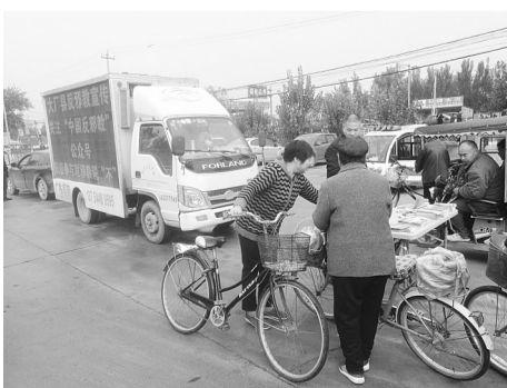
大厂回族自治县深入集市向群众开展“对邪教说不”主题宣传活动。图为过往群众在领取带有“中国反邪教”公众号二维码的宣传资料。(向东)

保定市徐水区防范办前不久会同该区东史端乡工作人员,在东史端乡下河西村集市上,开展了以“崇尚科学、反对邪教、珍爱生命、健康生活”为主题的反邪教宣传进村活动。活动中,防范办工作人员现场为大家讲解了邪教的种类、特征、危害以及防范抵御邪教侵扰的方式方法,国家取缔和打击邪教的法律法规等内容,同时向过往群众发放反邪教宣传袋500余个、揭批“全能神”邪教宣传册100余本,悬挂反邪教条幅5条。此次活动取得了较好的宣传教育效应,营造了积极向上健康和谐的反邪教社会氛围。(徐权)