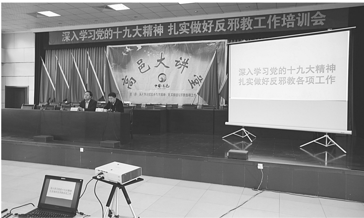
省防范办领导同志到高邑县作题为《深入学习贯彻党的十九大精神,扎实做好反邪教各项工作》宣讲。