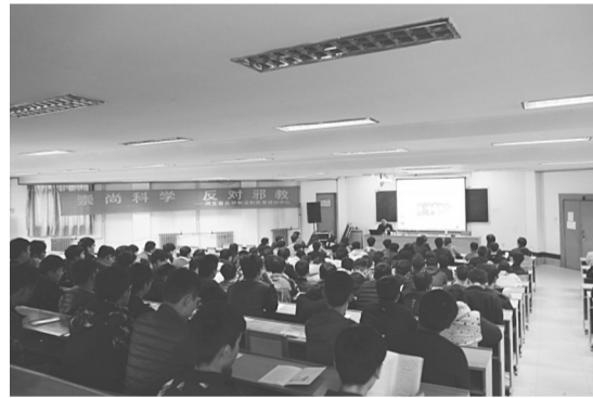
法教中心结合反邪教工作到学校宣讲十九大精神。