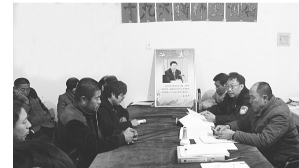
省防范办驻村扶贫工作组为驻村党员群众宣讲十九大精神。