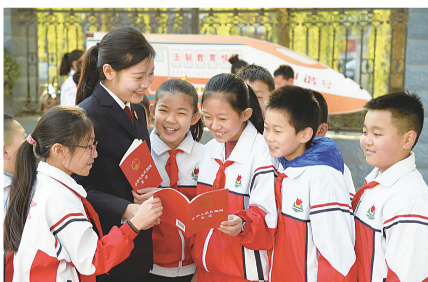
石家庄市桥西区检察院“阳光团队”的青年检察官们来到建胜路小学,开展国家宪法日校园法制宣传活动。图为检察官为同学们讲解宪法知识。