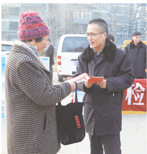
邯郸市峰峰矿区检察院组织干警走上街头开展国家宪法日宣传活动。干警为过往群众发放法律常识宣传册,解答群众提问,收到良好的社会效果。