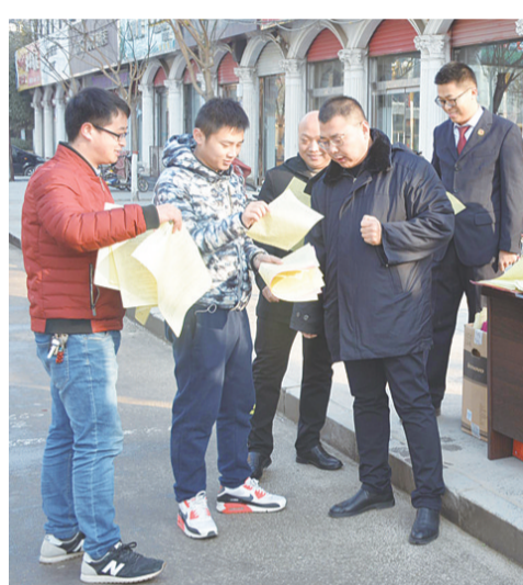
巨鹿县检察院组织干警上街,通过设置咨询台、派发宣传资料等形式,弘扬宪法精神,开展法制宣传,现场为群众提供多方面专业咨询。