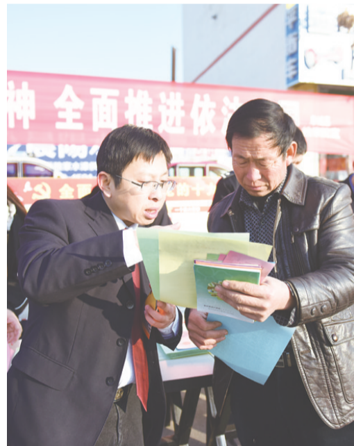
阜城县检察院干警在该县文体广场开展国家宪法日宣传活动,通过悬挂普法宣传条幅、发放宣传资料、现场咨询答疑等方式,向广大群众进行法制宣传。此次活动共向群众发放宣传资料1600余份,现场答疑90余人次。