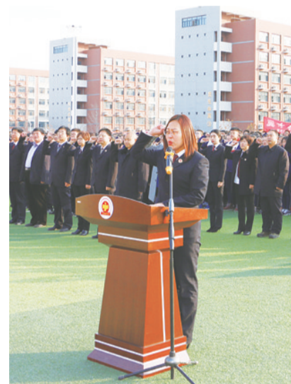
衡水市冀州区检察院干警走进冀州中学,和学生们一起进行宪法宣誓活动。通过活动的开展,进一步在检察官、广大师生中加强宪法知识教育,营造学习宪法、尊重宪法、敬畏宪法的浓厚氛围。图为检察官带领师生集体宣誓的场面。