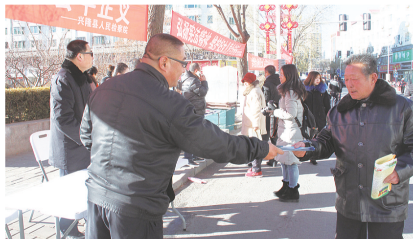
兴隆县检察院干警通过发放宣传资料、开展法律咨询等活动,宣传宪法以及与人民群众生产生活密切相关的法律法规,弘扬社会主义法治精神。活动中共发放宣传资料200份,为群众提供法律咨询20次,社会各界反响良好。