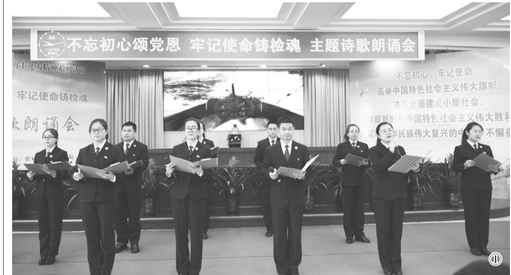
图①:11月10日,张家口市检察机关举行“不忘初心 牢记使命铸检魂”主题诗歌朗诵会。活动旨在推动学习宣传贯彻党的十九大精神,进一步弘扬检察主旋律、传播检察好声音,调动全体干警主动担当、跨越发展、事争一流的工作热情,更好地提升张家口检察队伍的凝聚力和战斗力。图为诗歌朗诵会现场。

予以综合惩戒,并采取罚款、拘留等强制措施,直至追究刑事责任。截至11月8日,已有10名被执行人在规定期限内履行了还款义务,另有3人已与法院或申请执行人联系,表达了在规定期限内还款的意愿。