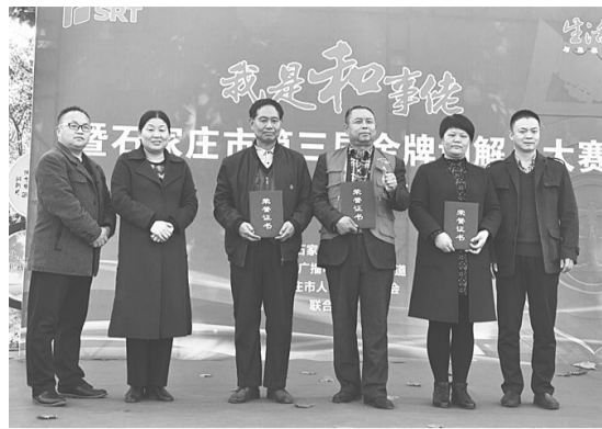
11月7日,新乐市司法局在新乐百福园广场举办了“第三届金牌调解员大赛”。通过层层评选出来的14名优秀调解员选手,经过自我介绍、简易矛盾纠纷分析答题、模拟调解等环节的激烈角逐,最终3名优秀调解员脱颖而出。之后,他们将赴石家庄参加十大金牌调解员评选。

该院延伸拓展惩戒触角,将符合条件的失信被执行人纳入全国法院失信被执行人名单库,并公布于中国执行信息公开网,在政府采购、招标投标、行政审批、政府扶持、融资信贷、市场准入、资质认定等方面加以严格限制。同时,采取冻结驾驶证不予年审、强制退出高额保险、限制出境、限制高消费等措施,压缩失信被执行人的生活空间,促使其产生诚信危机,迫使其主动履行义务。