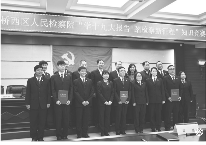
图②:近日,邢台市桥西区人民检察院组织全体干警开展“学十九大报告 踏检察新征程”知识竞赛活动,有效丰富了学习贯彻党的十九大精神的形式。通过这次比赛,再次掀起了该院干警学习党的十九大精神的热潮。图为赛后颁奖现场。