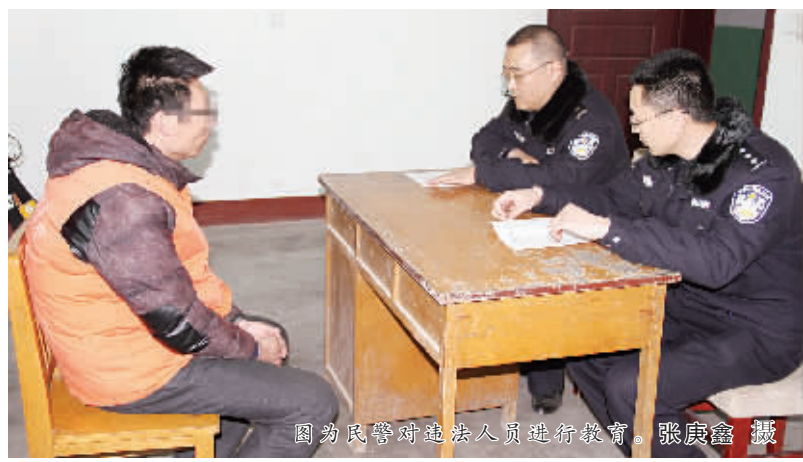
图为民警对违法人员进行教育。

2月3日,石家庄市鹿泉区公安交警大队全员出动,深入辖区重点运输企业、重点路段开展春运前的交通安全隐患排查。当日上午,该队城区中队民警到该区某客运公司对全体客运驾驶员的驾驶资质进行逐一检查时,发现刚刚进入试用期没几天的客运车驾驶人高某提供的驾驶证存在诸多疑点,民警经上核核查发现查无此证,高某的驾驶证系伪造,立即将此情况通知该公司负责人。在反复确认核查结果无误后,民警决定对高某实施强制措施。高某被突如其来事儿给整蒙了,民警告知高某