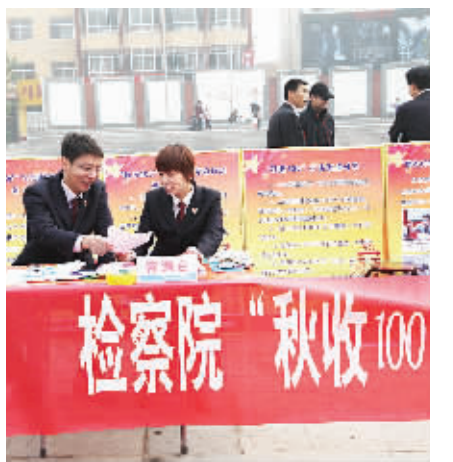
资讯图片:涿水县检察院积极部署“秋收100”打击整治专项行动,全警动员,强化措施,迅速掀起“秋收100”打击整治专项行动高潮。