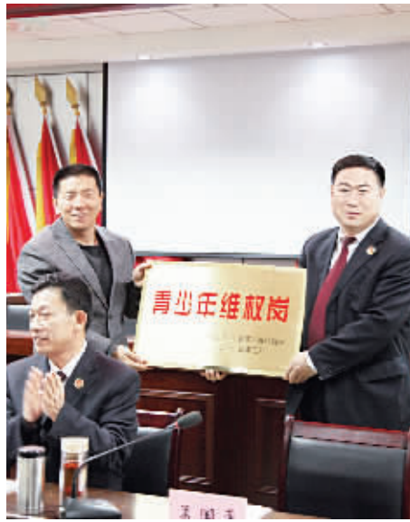
资讯图片:2014年11月,共青团中央代表全国“青少年维权岗”创建活动领导小组,正式授予涿水县检察院为2013年度全国“青少年维权岗”单位。

着力加强能力建设。以运行全国检察机关统一业务应用系统为契机,进一步深入推进案件管理工作,实现了案件网上流转、办理、签批,加强流程管理,实施质量监控,有效规范了执法行为。严格落实同步录音录像规定,扎实做好检察内网分级保护设备安装调试以及保密检查工作,为执法办案提供了有力保障。紧密结合检察工作对检察人员素质能力要求,有针对性地开展岗位练兵、技能培训和全员轮训,干警理论素养和综合素质得到提升。组织开展了“五大标兵”和“拔尖人才”评选活动,在全院营造了“比学赶超”的浓厚工作氛围。加强宣传调研工作,全年共在市级以上报刊网络发表宣传调研文章115篇,有效扩大了该院的对知名度影响力。坚持文化育检,组织开展了读书月、以“讲诚信、懂规则、守法纪”、“学习贯彻党的十八届四中全会精神”为主题的演讲比赛等系列活动,陶冶了干警情操,活跃了生活气息,促进了检察队伍建设。