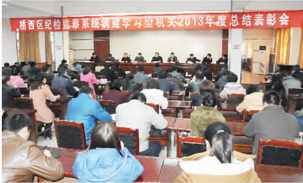
图为桥西区纪检监察系统创建学习型机关2013年度总结表彰会现场。

习;要善于利用多媒体技术和网络资源,丰富学习形式,拓宽学习内容。二是集中学习。每周五下午组织职工集中学习;结合当前工作,确定本周学习内容。