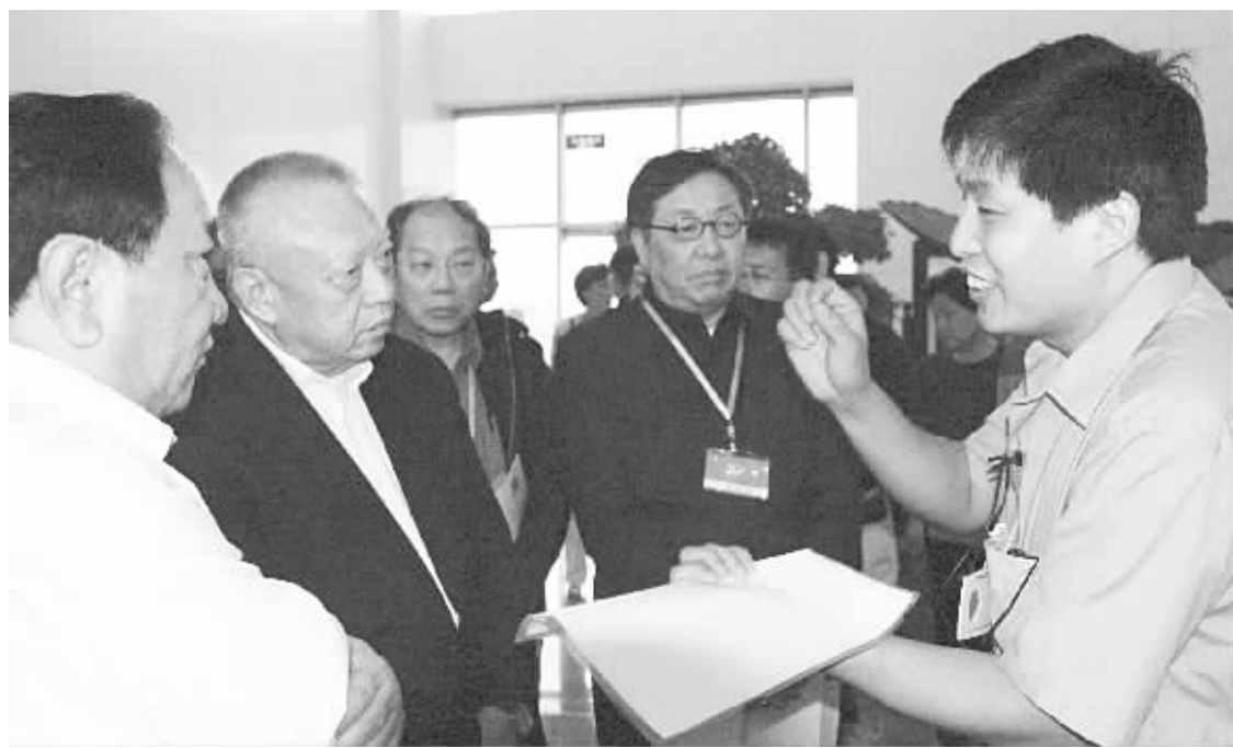
2006年7月24日,全国政协副主席董建华率驻香港政协委员到公司参观视察

从2004年打下第一根桩基,到各煤、炼焦、净化、动力以及相应公辅设施的全面建成;从两座年产110万吨焦炭的6米顶装复热式焦炉,到当今世界上炭化室高度最高、单炭化室容积最大、技术水平最优、自动化程度最好的四座6.25米捣固焦炉和国内领先的SCP一体车技术;从2005年11月28日,第一炉焦炭顺利推出,到如今年产330万吨焦炭的规模化生产,一项又一项成就,一个又一个辉煌,无不饱含着佳华人艰辛的汗水。