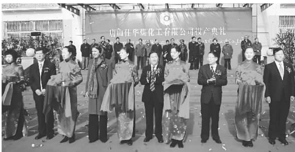
2005年11月28日,佳华公司隆重举行了一期工程投产典礼,北京市、河北省、唐山市等领导出席仪式

刚刚过去的10年,佳华公司日新月异,一路高歌猛进,它是承载着北京焦化厂希望的一粒种子,扎根在京唐港这片滩涂上,在建设者们汗水和心血的浇灌下,茁壮成长。如今,唐山佳华已经枝繁叶茂,由最初的几十人发展到现在的两千多人,十年前3000亩一眼望不到边的滩涂地上,已是座座焦炉耸立,生产热火朝天,生产生活条件大大改善,远非昔日能比。这其中的一张张图纸、一道道管线、一台台设备无不浸透着建设者的心血和智慧。佳华人不能忘记过去的艰辛,要接过建设者手中的接力棒,用他们的精神——勇于担当、顾全大局、合力拼搏、自强不息,砥砺自己的意志,尽心尽力、精诚团结。只有这样,唐山佳华在未来的发展道路上,遇到困难与挫折时,才能够重整旗鼓再出发,永葆发展的动力和战斗的活力。