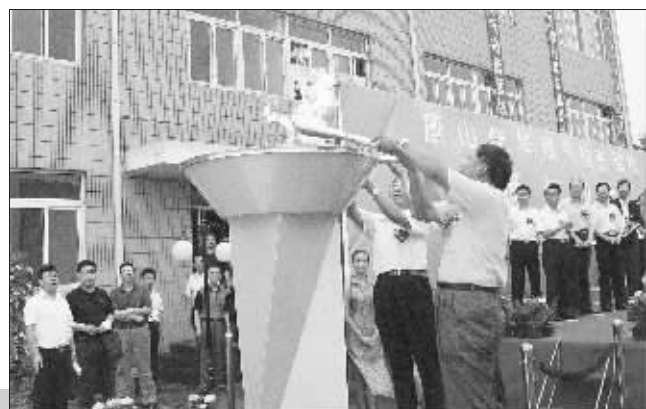
▲2006年7月18日,唐山佳华煤气输唐管线通气仪式在唐山举行

知是行之始,行是知之成。唐山佳华拥有坚定的价值观念,拥有目标始终如一的坚定行动,拥有不轻易为外界环境所影响的驾驭力量,唐山佳华必将成为煤化工行业的排头兵!