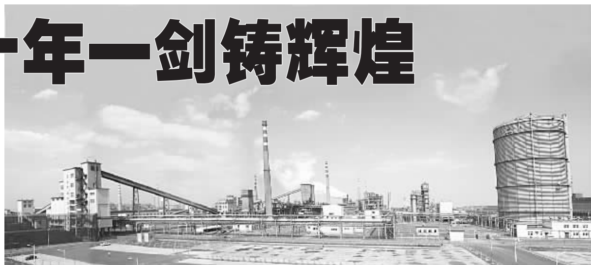
佳华公司厂区全景图

唐山佳华从2005年11月28日至2010年4月,共建成投产2座6米顶装复热式焦炉、4座6.25米捣固焦炉及配套装置,具备年产焦炭330万吨、年产煤气14.5亿立方米的生产能力,可根据客户需求生产:顶装一、二级焦炭,捣固一、二级焦炭,国标焦油、粗苯、硫酸铵、硫磺等产品。2013年,唐山佳华实现销售收入452391万元,上缴税金1864万元。目前,唐山佳华三期工程干熄焦、甲醇、合成氨项目正抓紧建设,预计年底前投产。