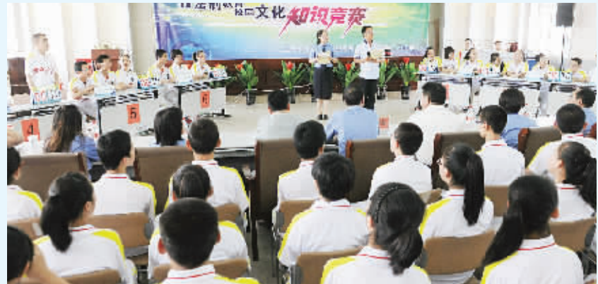
张家口市桥西区检察院采取选派法制副校长、举办法律知识讲座、心理辅导等多种形式,开展“送法进校园”活动,受到了学校师生和家长的一致好评。图为该院于日前组织张家口市第二十中学学生开展的法律知识竞赛。