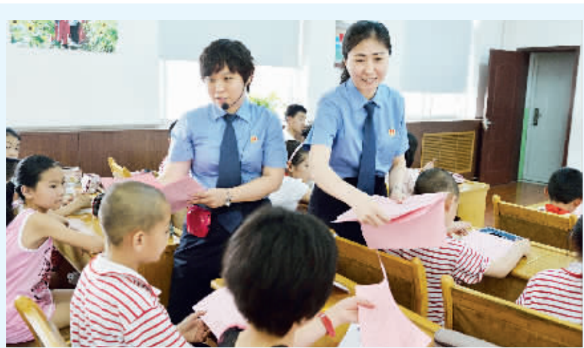
石家庄市桥西区检察院部分检察干警在“六一”儿童节之际,来到辖区城角街小学开办了“小学生安全自我防护模拟课堂”,通过多个生动的情景模拟剧和问答互动等形式,介绍法律常识和安全自救知识,提高学生们的遵纪守法意识和自我保护能力,干警们还向同学们发放了未成年人自我防护宣传材料,受到师生的欢迎。