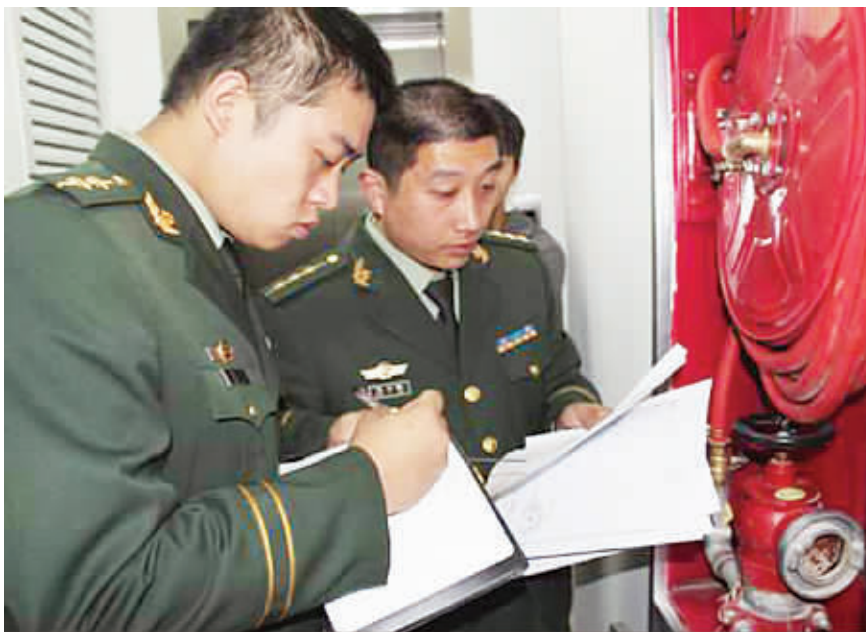
图为消防官兵正在仔细核对检查消防栓。