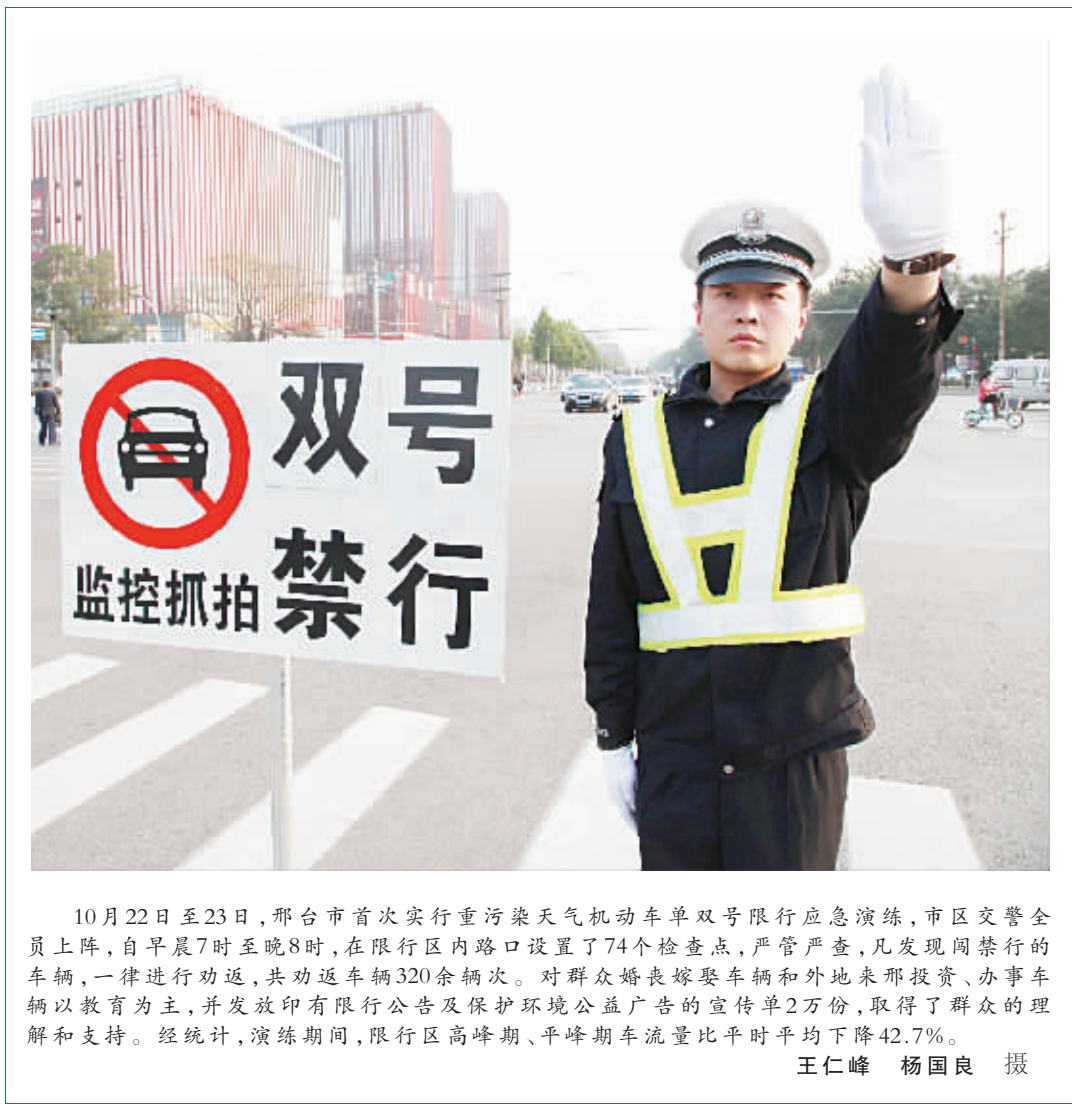
10月22日至23日,邢台市首次实行重污染天气机动车单双号限行应急演练,市区交警全员上阵,自早晨7时至晚8时,在限行区内路口设置了74个检查点,严管严查,凡发现闯禁行的车辆,一律进行劝返,共劝返车辆320余辆次。对群众婚嫁嫁娶车辆和外地来邢投资、办事车辆以教育为主,并发放印有限行公告及保护环境公益广告的宣传单2万份,取得了群众的理解和支持。据统计,演练期间,限行区高峰期、平峰期车流量比平时平均下降42.7%。

在此之后,遵化市检察院将公益诉讼延伸到国有资产损失案件。他们以国土出让金收缴、防空易地建设费收缴、环境污染等作为重点,通过发放督促起诉意见书,督促政府相关部门认真履行职责,依法提起诉讼,防止国有资产流失,打击环境污染犯罪。今年以来,遵化市检察院已向该市相关部门签发督促起诉意见书5份,收到良好社会效果。