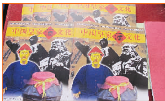
中国皇家酒文化研究院出版的《中国皇家酒文化》期刊

若提起来,可都是一个响当当的名字。中国酒界泰斗、中国白酒著名专家沈怡方出任皇家酒文化研究院名誉院长,百家讲坛著名讲师蒙曼、中国酒业协会白酒分会副理事长赵建华、中国酒业协会白酒分会秘书长宋书玉、中国白酒著名专家高景炎、中国辽金史学会副会长都兴智、中国民族史学会