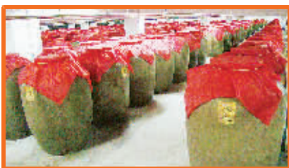
山庄老酒恒温恒湿皇家酒窖

康熙四十二年(1703年)七月二十三日,热河行宫奠基,康熙皇帝亲自主持,派人取八沟美酒御用并窖藏。康熙五十年(1711年)行宫初成,定名为避暑山庄。康熙皇帝即命名八沟美酒为“山庄老酒”。自此,山庄老酒皇家血统更加浓厚,其文化力量更加强大。山庄老酒皇家酿制技艺也在不断的发生、发展,其拥有特殊的酿造工艺及设备:固态发酵,泥巴窖,这些工艺承载着千百年来发酵产生的微生物,形成其香型的独特风格,泥窖中分离出的放线菌株,是千百年的老窖中生成的,淀粉酶活性较弱,蛋白酶活性较强,并能降解蛋白质大分子物质,促进酒中氨基酸的生成,对山庄老酒独特风味的产生起了很大的作用,发酵后缓火分层蒸馏,掐头去尾,看花摘酒,中温流酒,分段摘酒,经呼吸陶坛密封贮存,精心勾兑成为当今呈现在世人面前的山庄老酒。