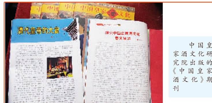
中国皇家酒文化研究院出版的《中国皇家酒文化》期刊