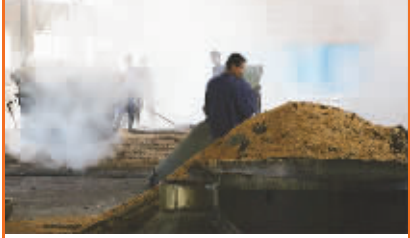
山庄老酒传承传统酿造工艺 打造正统皇室血脉