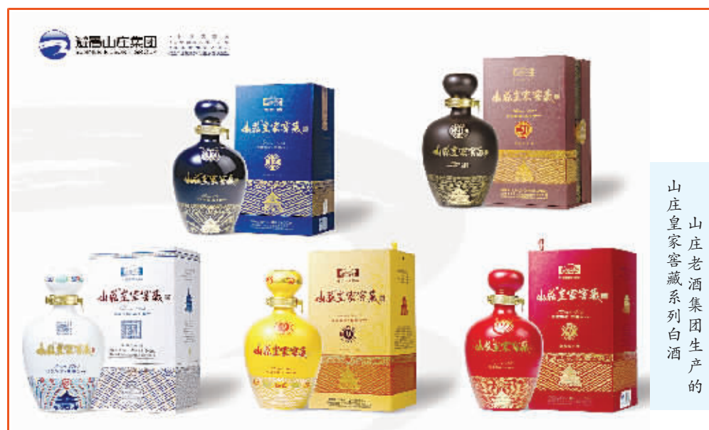
山庄老酒集团生产的山庄皇家窖藏系列白酒

皇家酒文化研究院成立的主旨,就是挖掘整理中国皇家酒文化,特别是清代皇家酒文化,进而加以研究、开发、利用和创新。研究院将相应的组织一些皇家酒文化研讨会、论坛峰会、培训讲座等,将推出山庄集团皇家酒文化地标项目,包括中国皇家酒文化博物馆、皇家名酒收藏、皇家酒器酒具陈列、皇家酒祖祭拜、皇家酒仪酒俗展示以及皇家窖藏封坛大典等,精心打造山庄老酒集团皇家酒文化的魂和根。