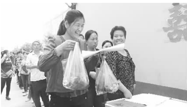
居民们领到免费发放的食品笑逐颜开