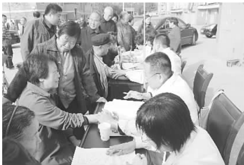
定期为老年人体检

在经济稳定发展上，后百家社区坚持“依托邯钢”做好社区集体经济发展文章。郭宏军充分利用与邯钢多年形成的诚信合作关系，大力服务邯钢，与邯钢建立了工农合作关系。2011年，社区工业总产值2.98亿元，上缴税金2300万元，人均收入1万元。