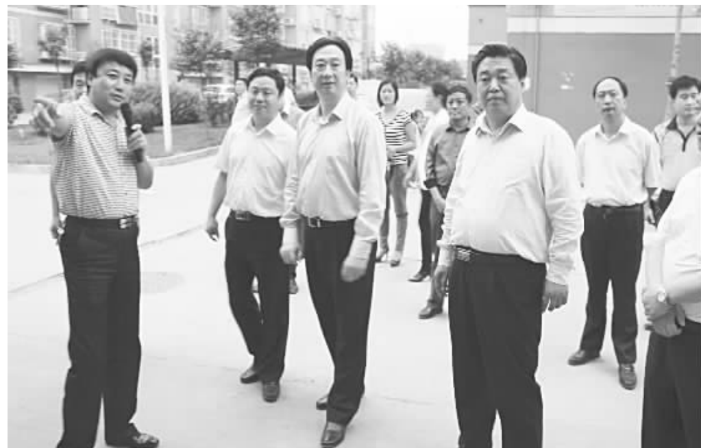
邯郸市委常委、组织部长陈平(中)到社区调研