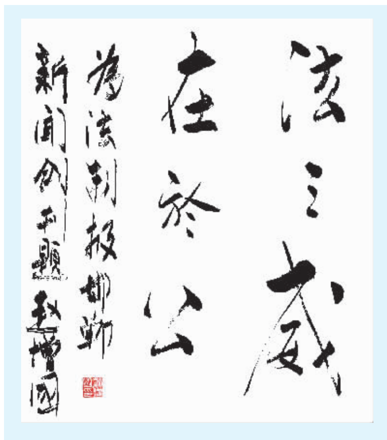
邯郸市中级人民法院院长 赵增国