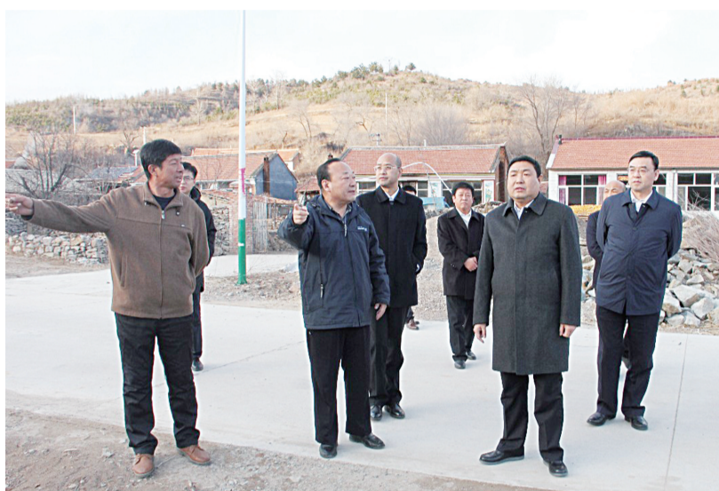
图为丁顺生检察长(前右一)在对口帮扶村考察指导的场面。

本报讯(刘树奇 魏永亮 李朴)承德市隆化县砬子沟村、南山根村、羊鹿沟村是省检察院对口帮扶的三个村。在省检察院党组高度重视、精心指导和省检察院驻村工作队用心、用智、扶贫、扶志的直接帮扶下,三个村的精准脱贫工作都取得了显著的成绩。近日,省检察院党组书记、检察长丁顺生再次来到这三个对口帮扶村,就扎扎实实做好下一步脱贫攻坚工作,确保如期高质量完成脱贫攻坚任务,脚踏实地考察指导精准脱贫工作,慰问勉励驻村扶贫工作队全体人员。