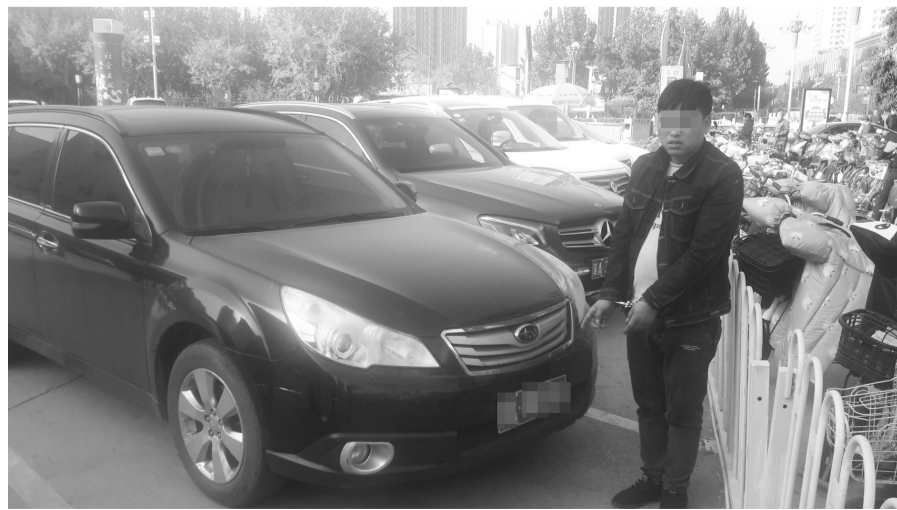
嫌疑人指认作案时所开的车辆。