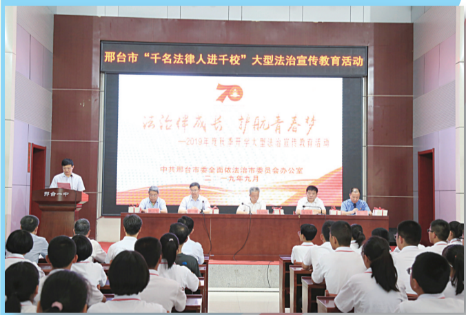
2019年9月6日,邢台市“千名法律人进千校”大型法治宣传教育活动启动仪式在邢台市一中举行。

邢台市司法局积极探索法治宣传教育工作的新思路、新途径和新方法,全面推进“法治邢台”建设,该市被授予“全国‘六五’普法中期先进城市”称号,省委常委、政法委书记董仚生对邢台普法教育工作给予批示肯定。今年3月份,全省普法与依法治理工作座谈会在邢台召开。