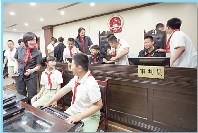
“红领巾”公众开放日小学生走进法院。

邢台市中级人民法院将社会主义核心价值观融入法院工作,创新家事审判方式,家事案件关键质效指标持续提升,统一裁判标准,规范类案审判,多措并举弘扬优良家风,通过发挥审判优势,践行了社会责任。