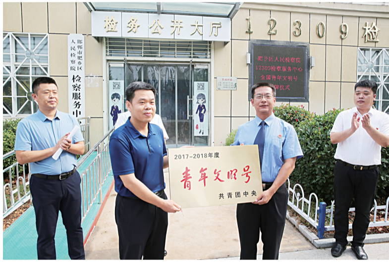
文明号、巾帼文明岗等荣誉称号。6月，肥乡区检察院12309检察服务中心被共青团中央等21家全国部委联合授予全国“青年文明号”荣誉称号。

近年来，肥乡区检察院12309检察服务中心以创建“学习型、服务型、创新型、和谐型青年文明号”为目标，以“您的满意就是我们的动力”为创建口号，为办事群众提供法律宣传、法律咨询和法律援助服务，打造“一站式”便民服务平台，真心服务群众，倡导文明风尚，打造了“正义检察蓝”这一青年品牌，提升了检察队伍良好的社会形象，成为全市青年工作的一面鲜亮旗帜。该中心先后获得市级、省级青年