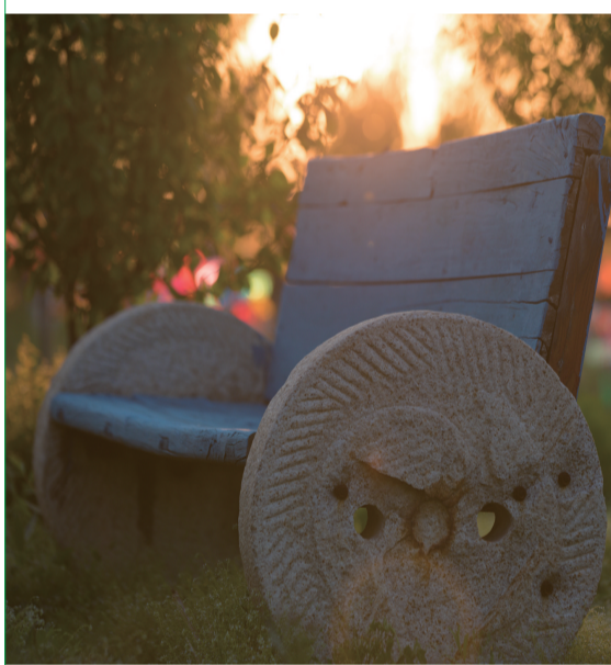
陆超 摄 (作者单位:兴隆县人民法院)

三哥小时候的经历和我差不多,我们都是拌炒面的伴随中长大的。娘做的炒面,一般都是三升细糠掺两升玉茭炒出来,正好够压一碾子的。我们都喜欢推碾子,一边推一边揉出玉茭籽嘎嘣嘎嘣的果实。春天夏天,一般先舀一碗汤,再挖半碗炒面,用筷子拌着吃了,往往拌炒面吃完了,汤也喝完了。天热时,我们都端着碗走出家门,聚在一起。孩子们好动,吃饭也闲不住,东拉西扯,逗乐时憋不住,“哧”地一笑,炒面喷出来,不定给谁挂个满脸花,就会引发一场开心的战争。