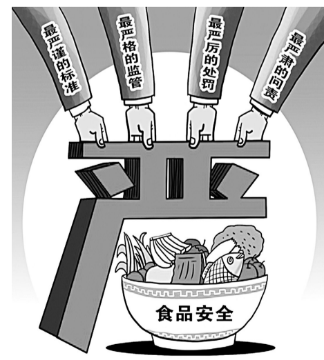
四个“最严” 新华社发 朱慧卿 作