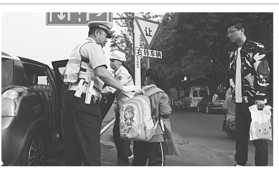
省会桥西交警大队进一步落实“一校一警”制,在辖区内位于主干道的小学门前道路上,继续深入开展“拉车门送孩子”活动,确保学生上下学“最后一百米”的安全,让家长放心、学校放心。