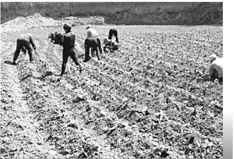
因村制宜发展红薯种植