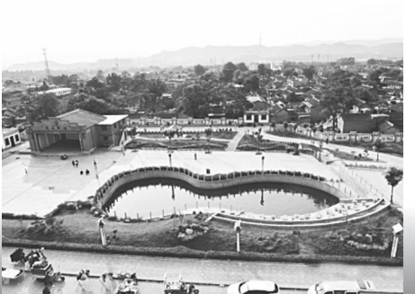
打造群众文化活动现场