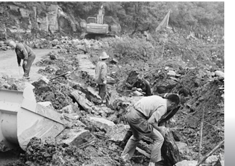
千群齐心修建农村公路