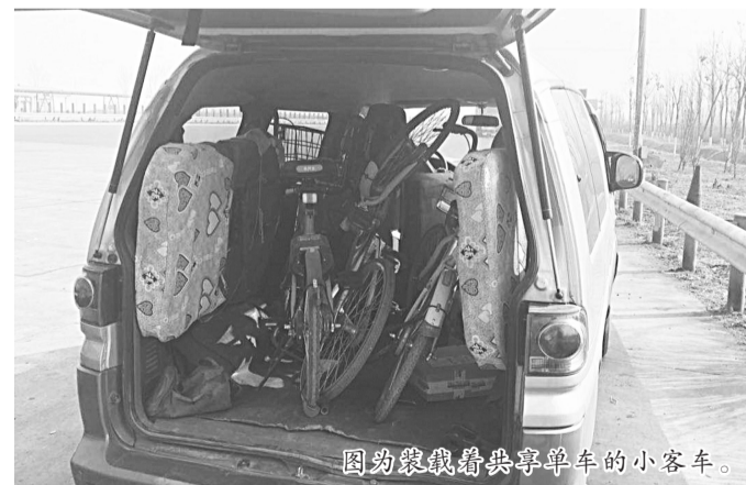
图为冀鲁籍带共享单车的小客车。

随后,民警对该驾驶人进行了教育,并联系当地派出所将该案件进行了移交,目前该案件正在进一步处理中。