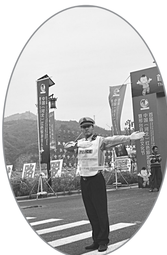
挥洒汗水, 展示卫士风采。

在今后工作中, 邢台县交警大队牢固树立以人民为中心, 生命至上, 安全第一的理念, 充分运用法制、科技、道德、文化的力量, 创新工作机制, 为建设“殷实富强、山清水秀、乡村美丽”的邢台县, 创造安全畅通、和谐有序的道路交通环境。