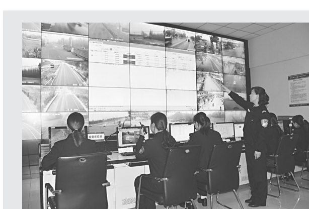
轻点鼠标, 路况尽在掌握。