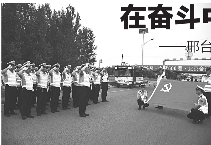
党建品牌, 统领队伍建设。