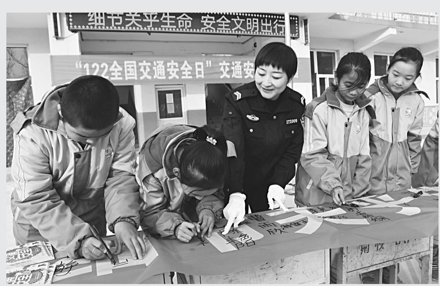
普法宣传, 浸润学子心田。