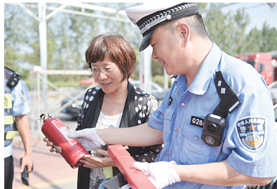
民警向驾驶人员讲解车载灭火器和紧急停车标识的使用。