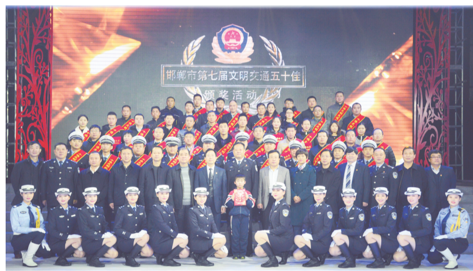
邯郸交警连年开展争创文明交通“五十佳”评选活动，褒扬先进，引领文明。