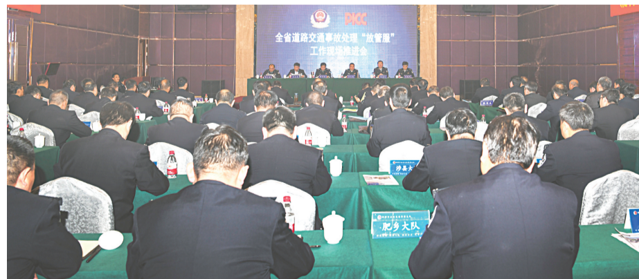
全省道路交通事故处理“放管服”工作现场推进会在邯郸召开，总结推广邯郸交警的经验做法。