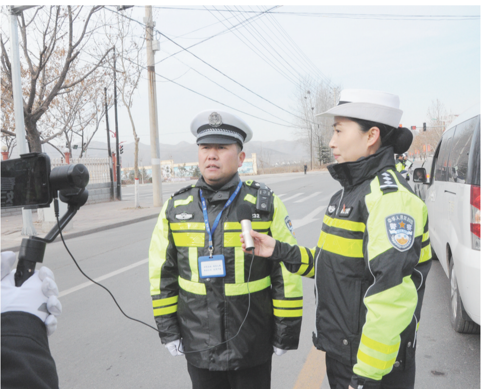
网络直播活动，既促进了民警执法的规范化，更是对交通违法者的现场监督。