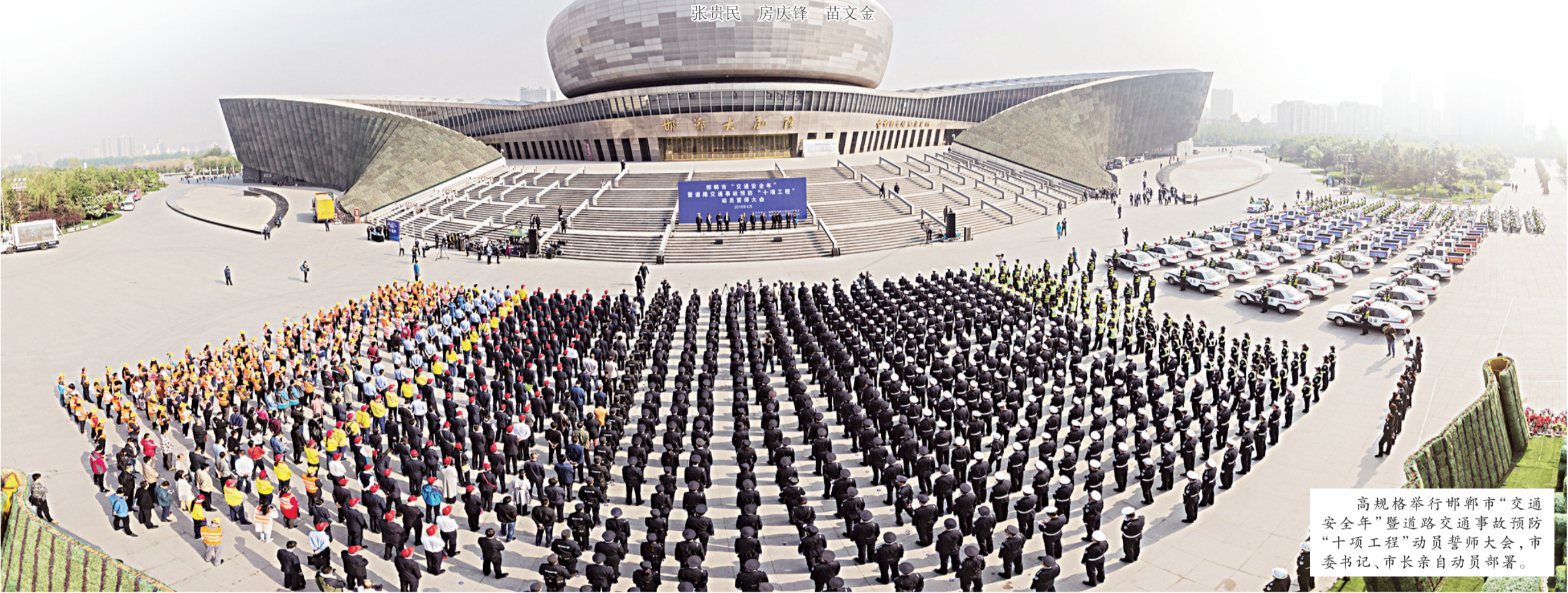
高规格举行邯鄲市“交通安全年”暨道路交通事故预防“十项工程”动员誓师大会,市委书记、市长亲自动员部署。