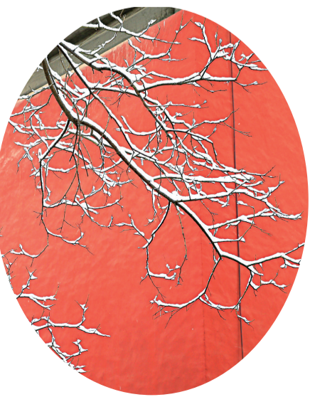
王世瑞 摄 (作者单位:承德市中级人民法院)