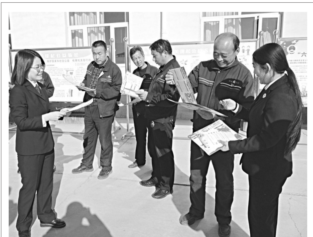
12月3日,赤城县人民检察院干警走进民营企业——张家口弘基牧业开发有限责任公司,就当前影响民营企业发展的相关问题征询公司负责人的意见和建议。赤城检察院负责人表示,检察机关将从打击、保护、预防、监督四个方面,找准服务民营企业的切入点,帮助企业建立起完善的管理制度,提高企业家和员工们的宪法意识和法治素养,通过打击侵犯民营企业合法权益的犯罪,为民营企业发展营造良好的外部环境。图为检察官在厂区开展普法宣传活动。