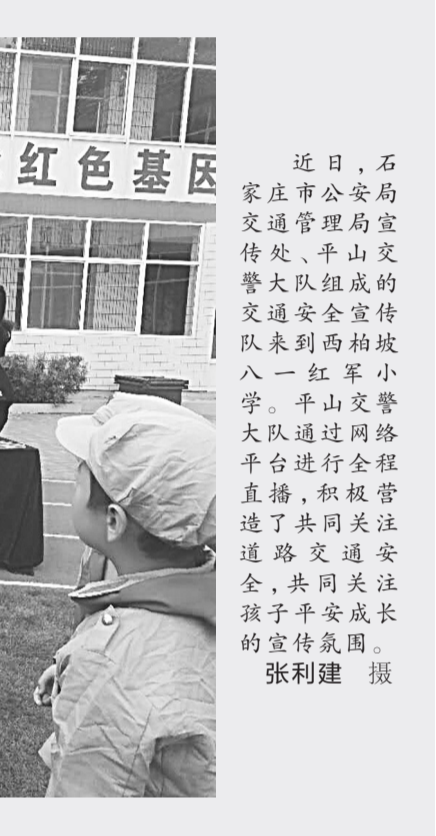
近日,石家庄市公安局交通管理局宣传处、平山交警大队组成的交通安全宣传队来到西柏坡八一红军小学。平山交警大队通过网络直播平台进行全程直播,积极营造了共同关注道路交通安全,共同关注孩子平安成长的宣传氛围。

过程中,私家车主家属与民警发生争执,在对其进行教育劝诫无果后,现场民警采取果断措施,将车主家属强行带离至派出所,铁轨上的小汽车被拖离现场,交通秩序得到恢复。