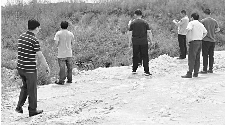
赞皇县检察人员针对向济河倾倒不明废液情况,到现场进行调查取证。

建立了公益诉讼监督平台。赞皇县检察院设立了公益诉讼办案中心,将“两法衔接”平台与公益诉讼平台对接,