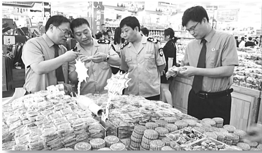
南和县检察院近日依法对县市场监督管理局开展的“双节”期间食品安全专项检查活动进行监督,推进食品安全监督工作日常化、规范化。图为检察人员与市场监管人员对辖区超市食品储存方式和餐具消毒等环节落实食品安全制度的情况进行专项检查。

本报讯(季河滨)近日,鸡泽县法院公开开庭审理金某杰等5人涉恶敲诈勒索案。与以往不同的是,本次庭审由法院院长担任审判长,县检察院检察长程学峰以国家公诉人身份出庭支持公诉。县委常委、政法委书记刘志强,县人大代表、政协委员、有关单位负责人及社会各界代表等共40多人参加了旁听。 该案系鸡泽县内首起团伙涉恶敲诈勒索案。被告人金某杰等5人为控制吴官营乡玉米芯收购,通过扎车胎、砸车窗、磁瓷等不法手段,多次对收购玉米芯货车司