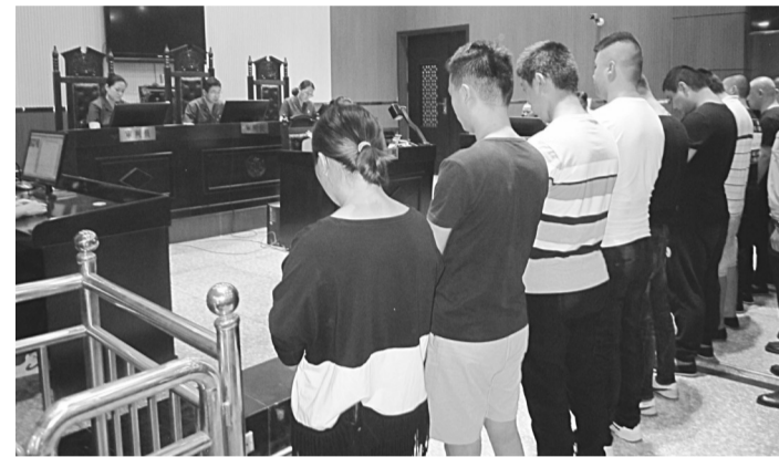
8月29日上午,井陘县人民法院依法宣判3起涉恶犯罪案件,20名被告人分别被判处有期徒刑4年至拘役不等刑罚。这是井陘法院首次公开宣判涉恶案件。图为法官集中宣判涉恶案件被告人。

法院深刻查摆工作作风上的种种表现,坚决避免能力不足不能为、动力不足不想为、担当不足不敢为的问题,建立台账,紧抓不放,彻底整改,真正解决“不能为、不想为、不敢为”的问题。