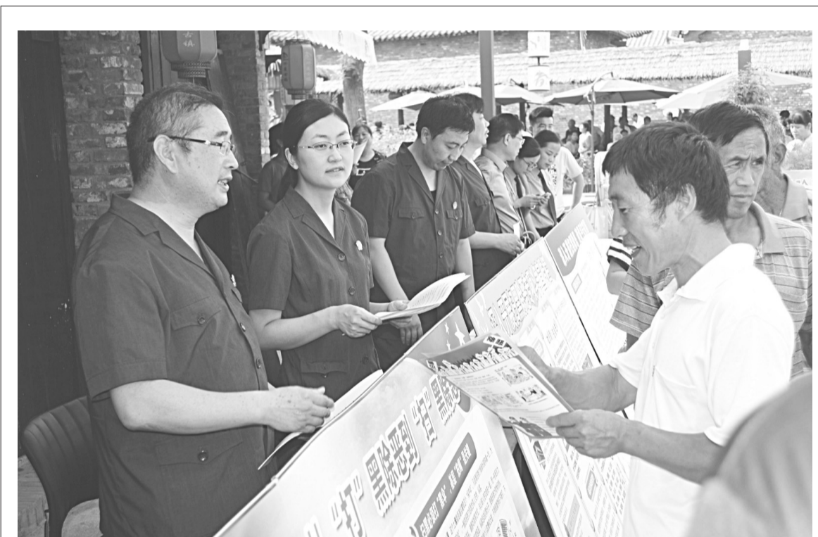
为进一步增强群众法律意识和扫黑除恶意识,日前,邢台县人民法院利用龙泉寺乡举办“那襄古镇”文艺会演的机会,组织干警们现场开展了扫黑除恶专项斗争集中宣传活动。

申领新闻记者证人员名单: 刘波 任俊颖 张世杰 刘东昕 郑亚 钟继光 刘小林 牛继芬 孙颖 郑金飞 柳红领 河北法制报社 2018年8月13日