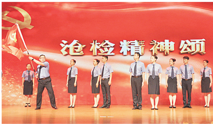
资讯图片:沧州市检察院组队参加河北省检察机关庆祝中国共产党成立97周年、庆祝检察机关恢复重建40周年诗歌朗诵会暨全省首届检察文化节开幕式活动。

以永远在路上的精神,以“务实+创新”的理念,以“传统+现代”的方法,推动文明创建工作提档升级。沧州市检察院高质量开展道德讲堂活动,采取邀请专家学者授课、领导干部上台等形式,加强社会主义核心价值观教育,弘扬忠诚公正清廉文明的检察职业道德;在重大节日,开展升国旗、唱国歌、党员干部宣誓等主题活动,激发广大干警的爱国情怀和做好工作的昂扬斗志;积极挖掘身边的先进典型,并将他们的事迹制作成“善行功德榜”在市院机关大厅展播。两年来,市院机关先后涌现出“全省模