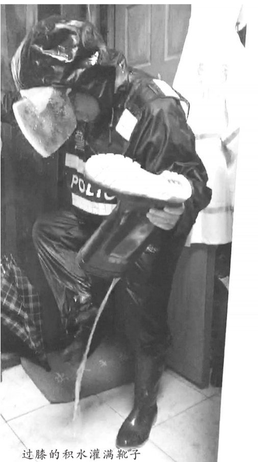
过膝的积水灌满靴子