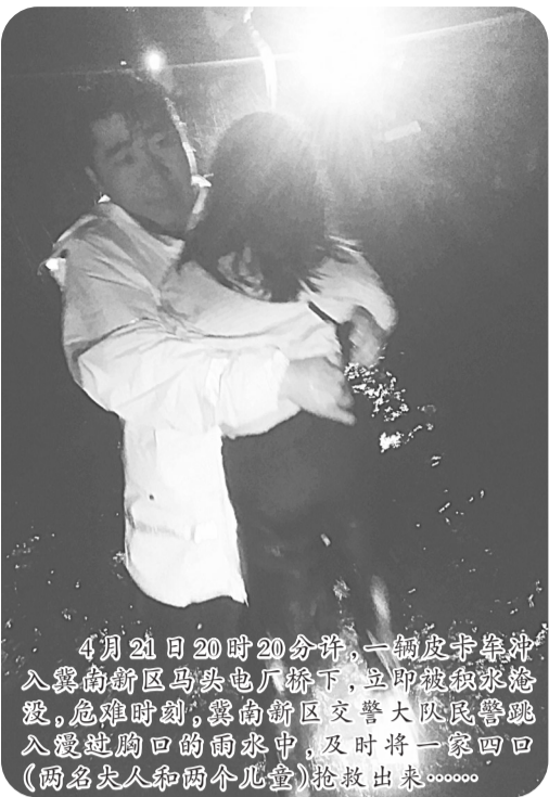
4月21日20时20分许,一辆皮卡车冲入冀南新区马头电桥下,立即被积水淹没,危险时刻,冀南新区交警大队民警跳入没过胸口的雨水中,及时将一家四口(两名大人和两个儿童)抢救出来……