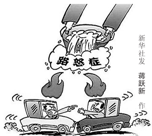
新华社发 蒋跃新作

被告人张某故意伤害他人身体,致人轻伤一级,其行为已构成故意伤害罪,事实清楚,证据确实、充分。同时,本案中的被害人也存在一定过错,法院在量刑时予以考虑。被告人张某自愿认罪,态度较好,并积极赔偿被害人经济损失,有悔罪表现,并得到被害人的谅解,其在社区同意对其进行社区矫正,法院在量刑时酌情予以从轻处罚,依法对其实行社区矫正。