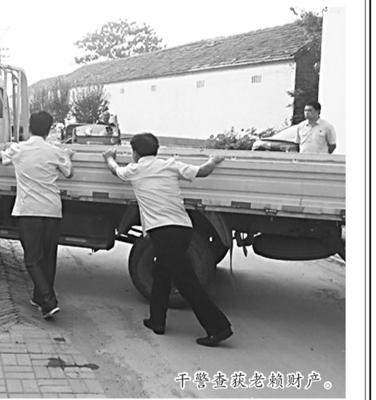
干警查获老赖财产。