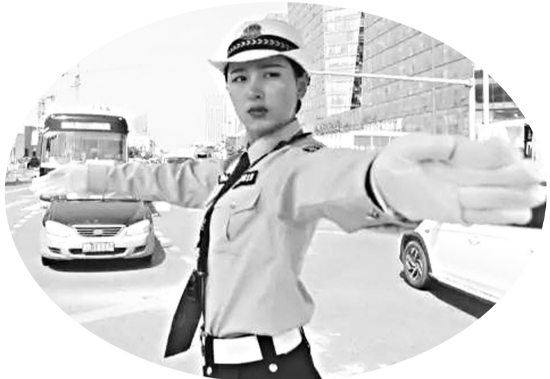
图为全副武装的女警在路口指挥交通。

明珠岗女子中队共13人,平均年龄22岁,今年3月底上岗。作为廊坊交警首支女子中队,一亮相就得到了群众和社会的广泛关注。全体队员每天7时50分集合,晚上7时下班。她们执勤认真、动作规范,还帮司机推车,或