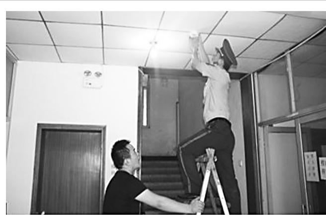
日前,易县消防大队消防人员深入辖区养老院,指导养老院人员安装独立式烟感报警器,并将日常维护保养方法和如何检查、测试独立式烟感报警器进行了讲解,提升了养老院抵御火灾的能力。王媛媛 摄

秦皇岛市律师协会表示,将尽快设立公职律师专门委员会等机构,加强对公职律师的行业管理。