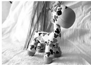
妈妈缝制的手工作品。

一台老式缝纫机，几块布头，些零碎布，这是老妈的宝贝。这些零零碎碎，在老妈裁裁剪剪、缝缝补补下，涅槃重生，惊艳亮相。