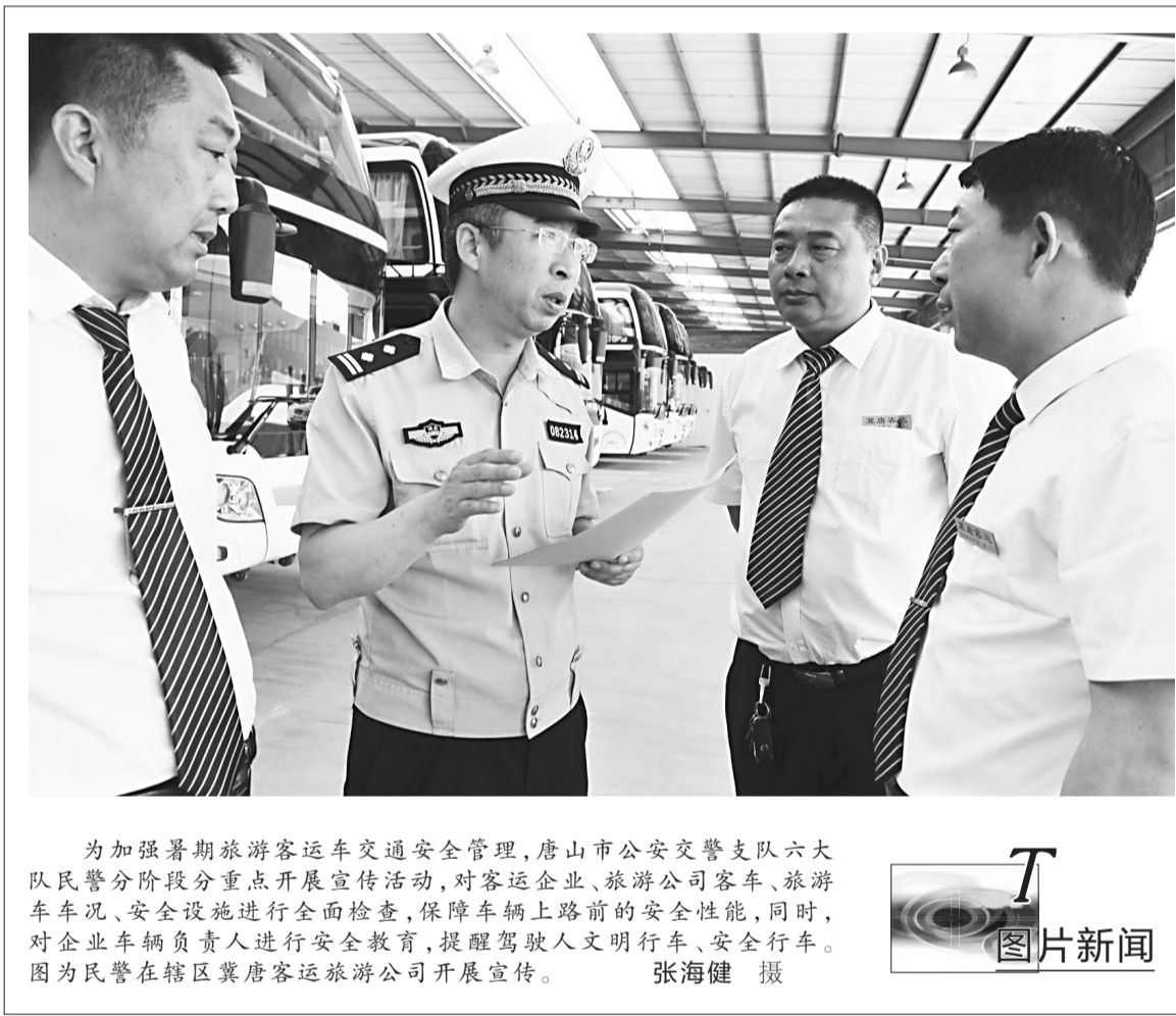
为加强暑期旅游客运车交通安全管理,唐山市公安交警支队六大队民警分阶段分重点开展宣传活动,对客运企业、旅游公司客车、旅游车车况、安全设施进行全面检查,保障车辆上路前的安全性能,同时,对企业车辆负责人进行安全教育,提醒驾驶人文明行车、安全行车。图为民警在辖区冀唐客运旅游公司开展宣传。

活动中,该局将加大对各地活动的督促指导,强化专项调研、随机抽查和定期督导,对活动中发现的问题,及时梳理、限期整改,以促进工作措施落实。同时,及时总结先进典型经验,以设立活动专题网站,开辟简报、专报等形式及时反映工作动态和经验做法,激励广大民警不断增强和提高党性修养、规矩意识、能力素质,积极引导广大民警用改革的思维、发展的办法、创新的思路解决问题、推动工作,打造激情工作、奋勇争先、比学赶超、争创一流的公安队伍。