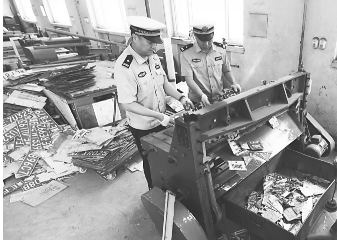
5月18日,邢台市交警支队集中销毁假牌套牌522副。据悉,此次销毁的牌子均是3月开始的京津冀地区机动车假牌套牌违法行为集中整治期间民警查获的。整治过程中,他们共查获假牌套牌违法行为522起,其他涉牌违法行为179起,扣留机动车89辆,其中盗抢车2辆,行政拘留54人,有效地震慑了此类违法行为的发生。

运用高科技手段进行统一作战指挥是今年“5·18”安保工作中的一个亮点。“5·18”安保合成作战指挥部指挥长聂志强介绍,廊坊市公安部门在京津冀大数据创新应用中心设立了合成作战指挥部,各个研判系统全部接入,即时分析研判,即时研究对策,即时采取行动;在外围实施人证合一比对,及时发现可疑人员;在高空,四架无人机不间断巡航监视,在地面,天网摄像头无缝隙覆盖,在场馆,移动警务终端随时回传现场态势;在通信保障上,电台、视