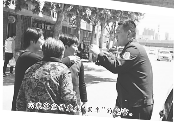
向乘客宣讲乘坐“黑车”的危害。