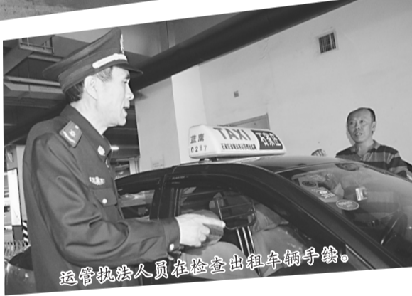
运管执法人员在检查出租车手续。