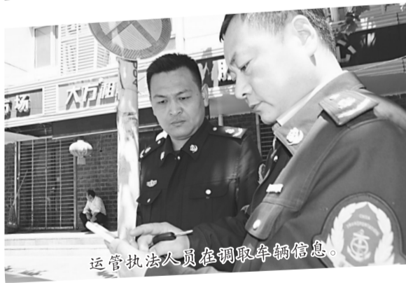
运管执法人员在调取车辆信息。