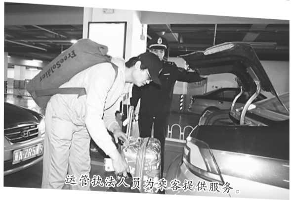
运管执法人员为乘客提供服务。