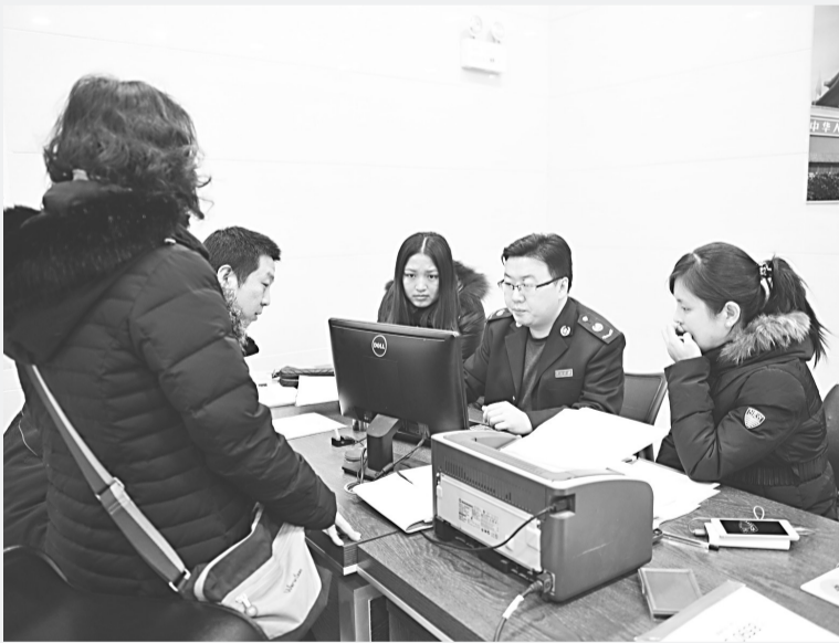
春节前夕,石家庄高新区地税局办税服务厅业务量明显增长、排队等待人数急剧上升,该局办税服务厅及时采取应急措施,启动应急预案,全员上岗,增设临时窗口,提供延时服务,保证当天办税当天办结。